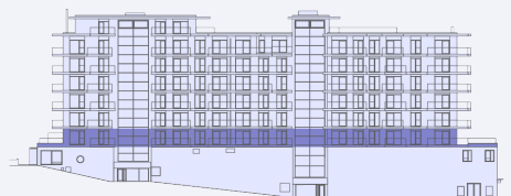
pozice v rámci podlaží